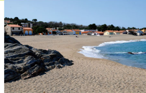
La plage du Racou à Argelès-sur-Mer.

8 Descendre dans l'anse de la Mauresque avant de remonter à flanc de butte. Au sommet, descendre vers la zone portuaire. Par une rue à droite, gagner les quais de Port-Vendres, puis la place de l'Obélisque ( 9 ).