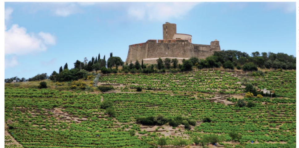
Le fort Saint-Elme domine Collioure.

Communauté de Communes Albères Côte vermeille