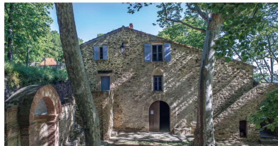
Sur le chemin, l'ermitage de Notre-Dame-de-Consolation.

• ermitage Notre-Dame-de-Consolation • musée d'Art moderne • vignobles • fort Saint-Elme