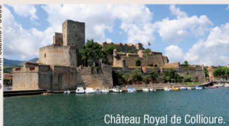
Château Royal de Collioure.